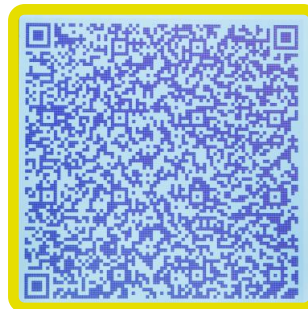
QR Code Einblendung der Messwerte Displays the QR code with the measured values