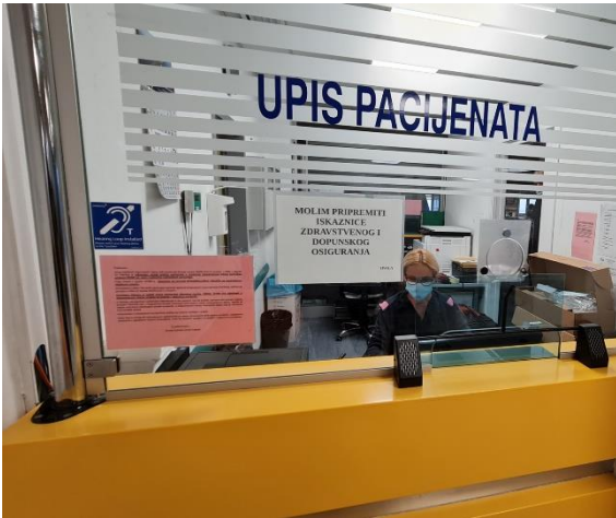
ŠALTER ZA UPIS PACIJENATA