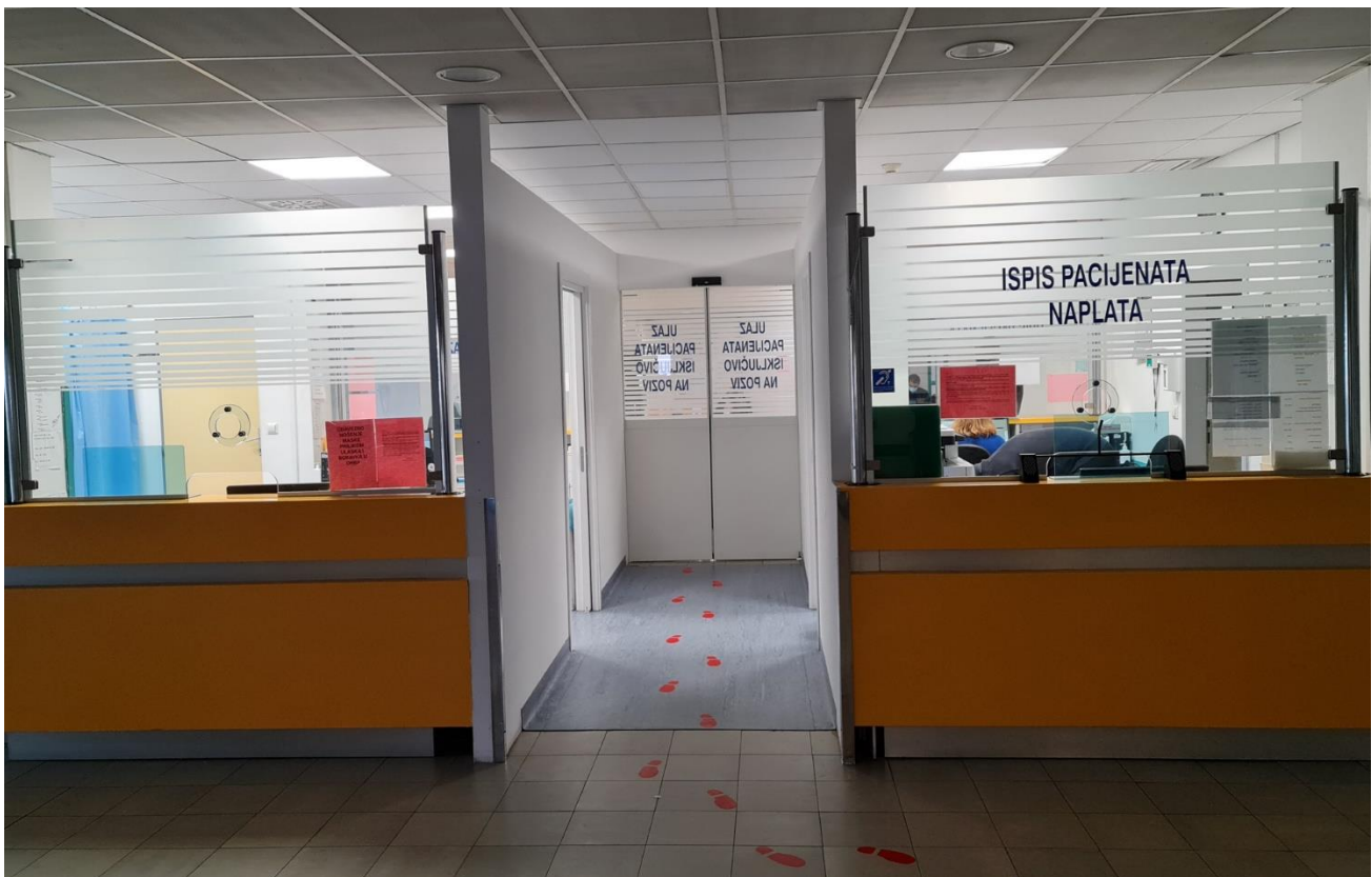
KLINIČKI BOLNIČKI CENTAR – ZAGREB (REBRO) - TRIJAŽA – HITNA SLUŽBA