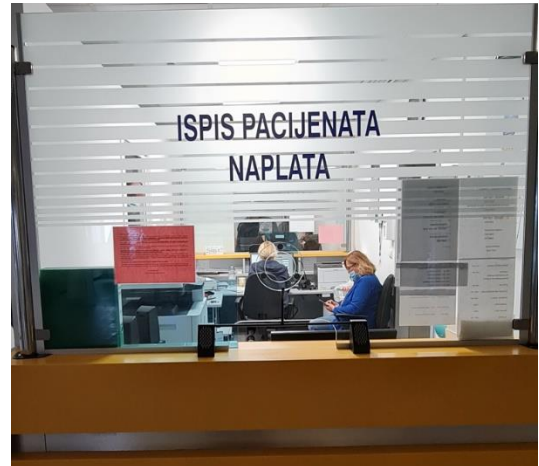
ŠALTER ZA ISPIS PACIJENATA